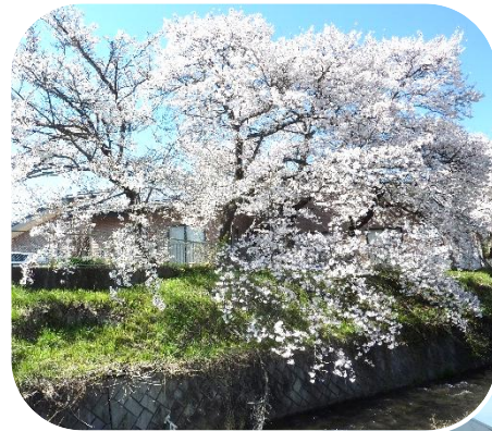
共生館裏の桜も見頃に(4/8撮影)

例年より1週間ほど早く「満開」となり、来館者やスタッフの目を楽しませてくれました。